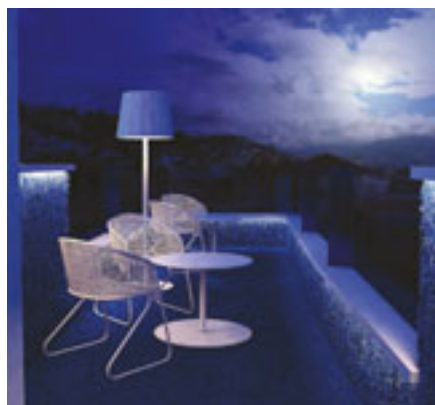
Dall'alto, in senso orario, due immagini del ristorante, la terrazza sul tetto dell'edificio e il coffee bar.